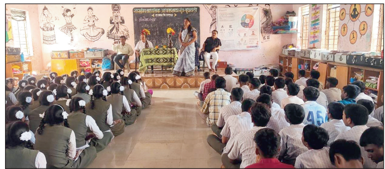
सावित्रीबाई फुले जन्माला आल्या नसल्या तर महिलाही अशिक्षित राहिली असती चुल आणि मुलं यामध्ये